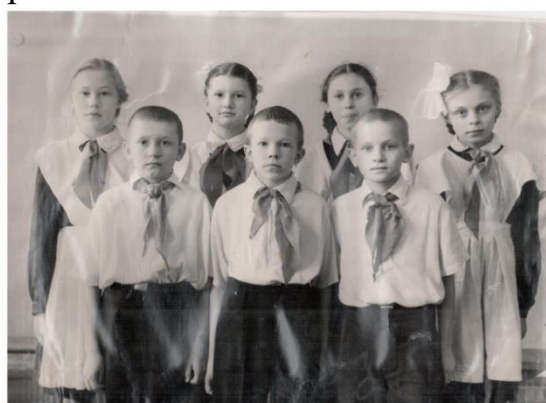
Лучшая октябрятская звездоочка и пионерское звено (1950-е годы)

В 1957 году в школе прошёл фестиваль трудолюбивых, ловких, весёлых. Кружки «Творческий» и «Художественное слово» награждены дипломами за успехи в работе.