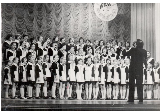
Выступает пионерский хор (1979 г.)

Школьный хор занимает призовые места на районных и городских конкурсах.