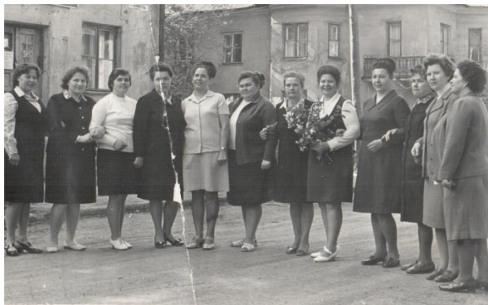
Коллектив учителей школы (1960-е годы)

Под руководством нового директора в школе работают творческие педагоги. В школьную практику внедрялись передовые педагогические технологии. На уроках применялся дифференцированный метод обучения. Заключался метод в негласном делении учеников на группы по их способностям, и каждая получала задания определённой степени сложности. Дифференциация позволяла не сдерживать развития способностей одарённых учеников и повышала общую успеваемость.