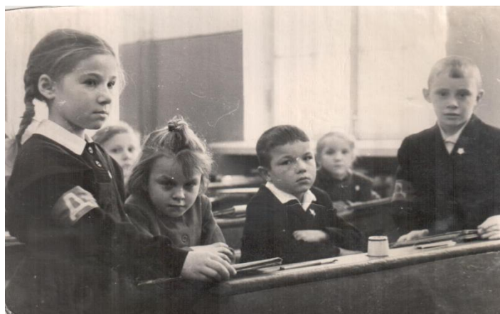
Первые ученики школы (1951 год)