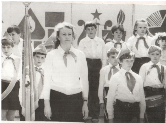
Лучшие пионеры школы

В 1978 году пионерская дружина получила грамоту за отличную работу по маршруту «Моя Родина - СССР». Стенные газеты школы заняли 2 место в районе на смотре, посвященном 60-летию Великой Октябрьской Социалистической Революции. В 1979 году пионерская дружина и октябрятская организация школы стали одними из лучших в районе.