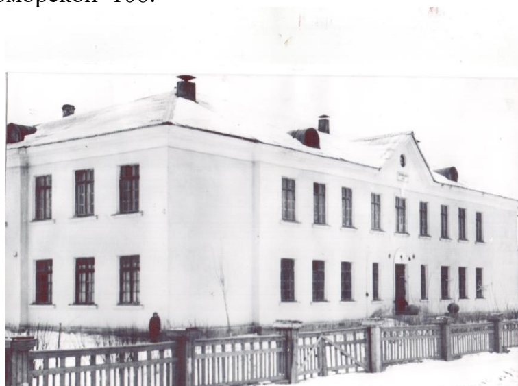
Здание новой школы (1951 год)

16 августа 1951 года происходит реорганизация начальной школы в неполную семилетнюю школу. Школа переехала в новое здание на улице Черноморской 106.