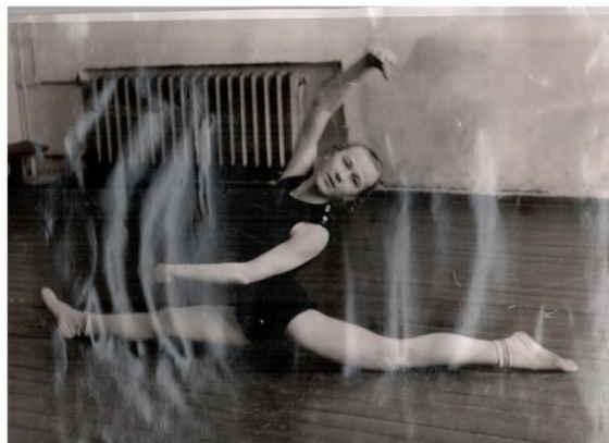
Занятие кружка художественной гимнастики

В 1962 году хор учеников школы награждён почётной грамотой за хорошее исполнение песни «Дружба, единство, мир». Продолжается сотрудничество школы с подшефным совхозом Огнеупорного производства. Коллектив школы награждён похвальным листом Тагилстроевского районного отдела образования. Большое внимание уделяется физическому развитию и экологическому воспитанию школьников.