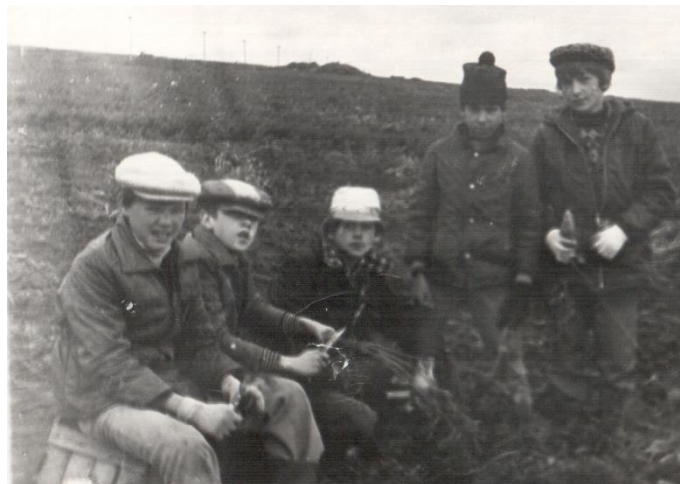
Помощь школьников колхозу в уборке урожая

В 1956 году в школе созданы октябрятская и пионерская организации, вручено пионерское знамя и его паспорт.