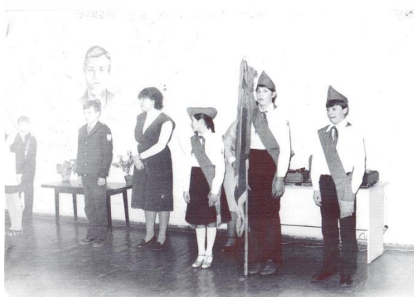
Знамённая группа школы (1983 г.)