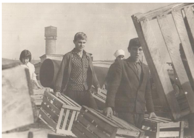
Старшеклассники работают на овощной базе

В 1980-е годы продолжают трудовые традиции. Ученики седьмых и восьмых классов помогают овощной базе в сортировке овощей.