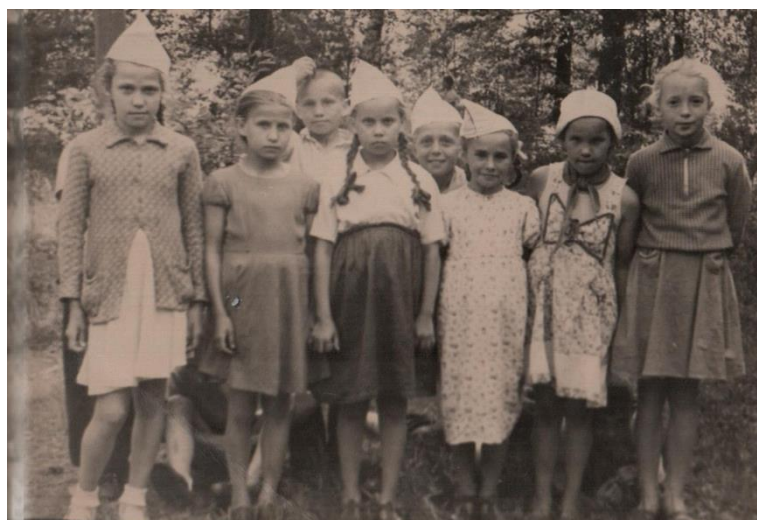
Детский лагерь при школе (начало 50-х годов)