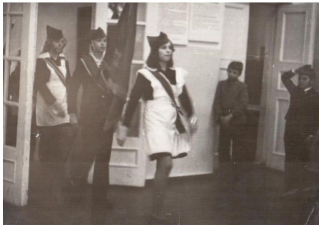
Знамённая группа школы